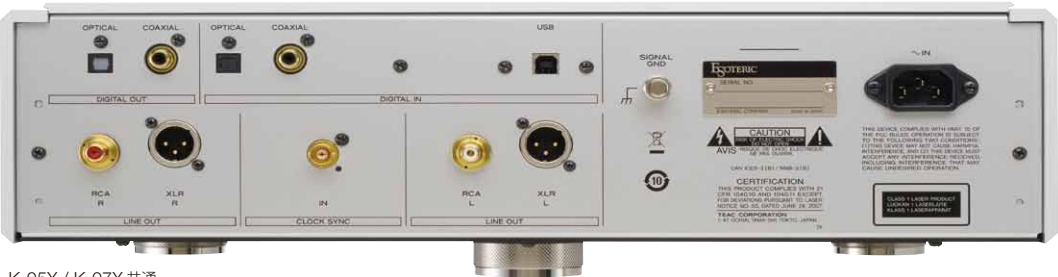
K-05X / K-07X 共通